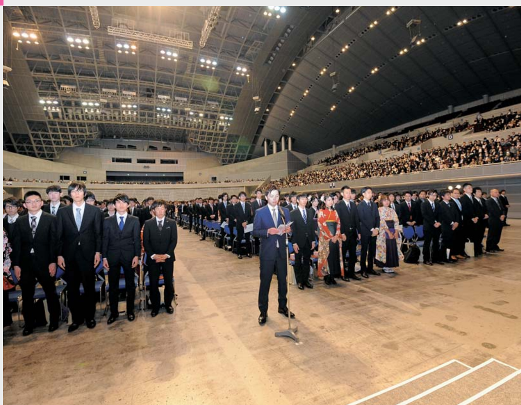
「平成28年度 学位記授与式」